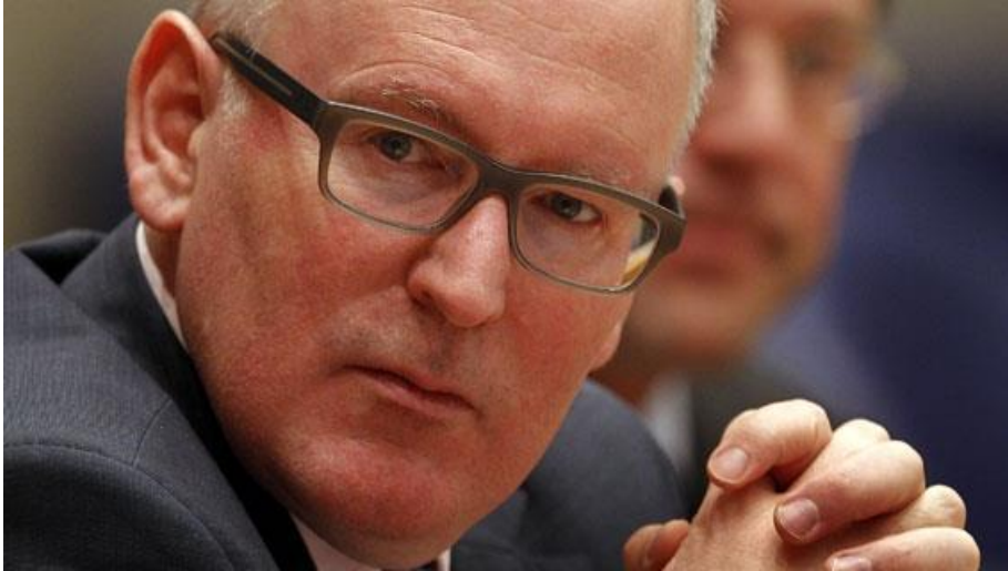
Uygulamaya dair bir Timmermans Planı’na ihtiyaç var

Alman Phoenix TV kanalı, “Streit um Visafreiheit – Kippt der Türkei-Deal?” (“Vizesiz seyahat tartışması – Türkiye ile yapılan anlaşma çöküyor mu?”) (17 Mayıs 2016)