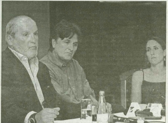
Shoqëria Civile e Kosovës i ka bërë apel Bashkimit Evropian që mos ta getozojë Kosovën me politikën diskriminuese të vizave

Në vizitën e tij që i ka bërë pak ditë më herët Kosovës, Përfaqësuesi i lartë i BE për Politikë të Jashtme dhe Siguri, Javier Solana, ka thënë se kur është iniciuar ky proces Kosova nuk ka qenë shtet, megjithëse ai ka premtuar se liberalizimi i vizave do të vazhdojë edhe me shtetet e tjera të Ballkanit Perëndimor.