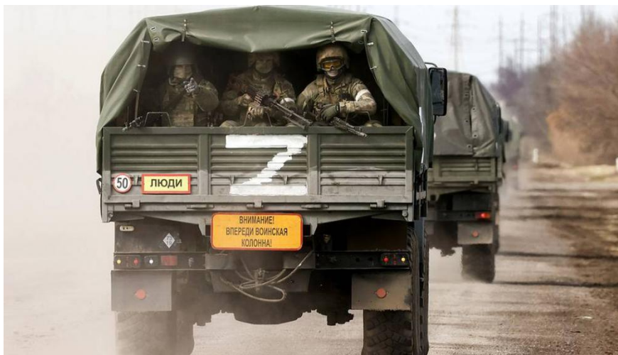
L'invasion de l'Ukraine par la Russie

Et pourtant, pendant de nombreuses années, les gouvernements successifs du Kosovo ont été vivement découragés par les membres du Conseil de l'Europe de déposer une demande d'adhésion. Le résultat : Le Kosovo est dehors. Il est aujourd'hui la seule démocratie européenne à ne pas être membre du Conseil de l'Europe.