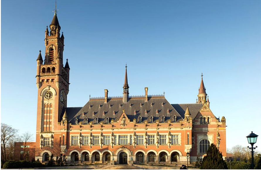
La Cour internationale de Justice

En octobre 2008, l'Assemblée générale des Nations unies a posé une question simple à la Cour internationale de Justice (CIJ) siégeant à La Haye : “La déclaration unilatérale d'indépendance des institutions provisoires d'administration autonome du Kosovo est-elle conforme au droit international ?” En juillet 2010, la CIJ a conclu que “la déclaration unilatérale d'indépendance du Kosovo adoptée le 17 février 2008 n'a pas violé le droit international”.