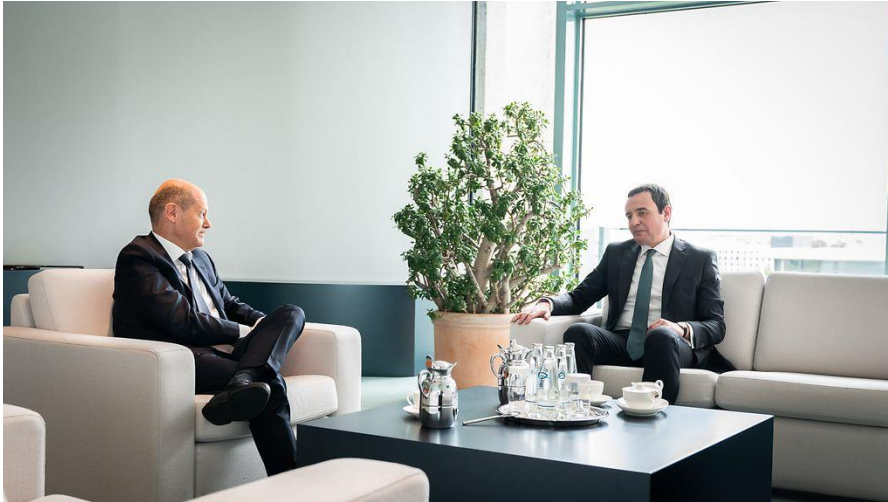
Olaf Scholz et Albin Kurti à Berlin

Lors d'une visite au Kosovo en mars 2022, la ministre allemande des affaires étrangères, Annalena Baerbock, a salué "l'orientation réformatrice particulièrement forte" du nouveau gouvernement du Kosovo : "Le Kosovo a tenu ses promesses. Maintenant, c'est à l'Union européenne de tenir les siennes."