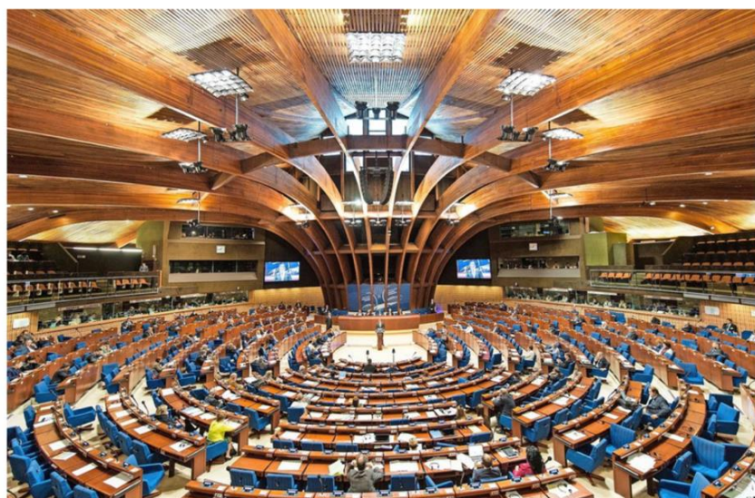
Nicht mehr dabei: Der Europarat ohne Russland

“Russia out, Kosovo in?” , Frankfurter Allgemeine Zeitung, 23 avril 2022