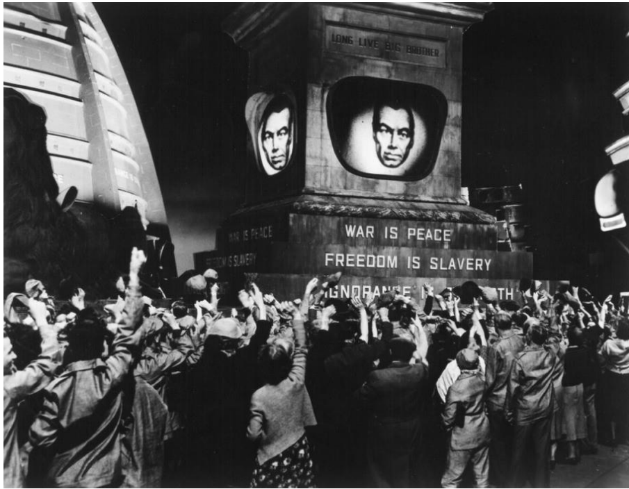
El mundo de 1984 de George Orwell: La guerra es paz La libertad es esclavitud La ignorancia es fuerza

De hecho, la Rusia de Putin es cada vez más indistinguible de la Oceanía de George Orwell: un lugar de tortura y represión, en permanente guerra con otras potencias para legitimarse, gobernada por un Partido que emplea una Policía del Pensamiento para perseguir el pensamiento independiente, todo en nombre de su líder dictatorial. ¿Podría Oceanía seguir siendo miembro del Consejo de Europa y éste conservar su credibilidad?