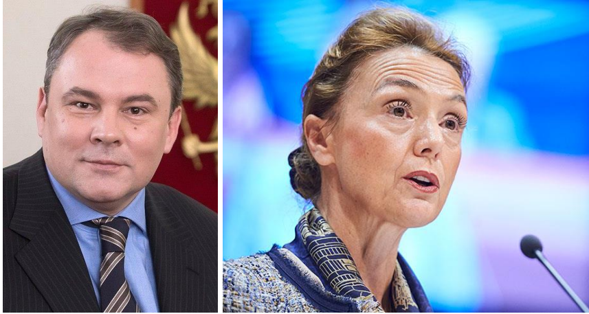
Pyotr Tolstoy – Marija Pejcinovic Buric

“Ahora la reanudación de nuestras conversaciones dependerá del Consejo de Europa. Los rusos no vamos a cambiar.”