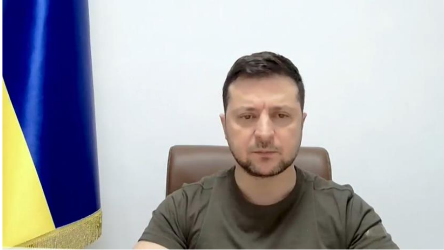
Volodymyr Zelensky se dirige a las Cámaras conjuntas del Parlamento en Londres

El martes 8 de marzo, el presidente ucraniano Volodymyr Zelensky se dirigió a las Cámaras conjuntas del Parlamento en Londres. Resumió los acontecimientos desde que comenzó la guerra contra su país: