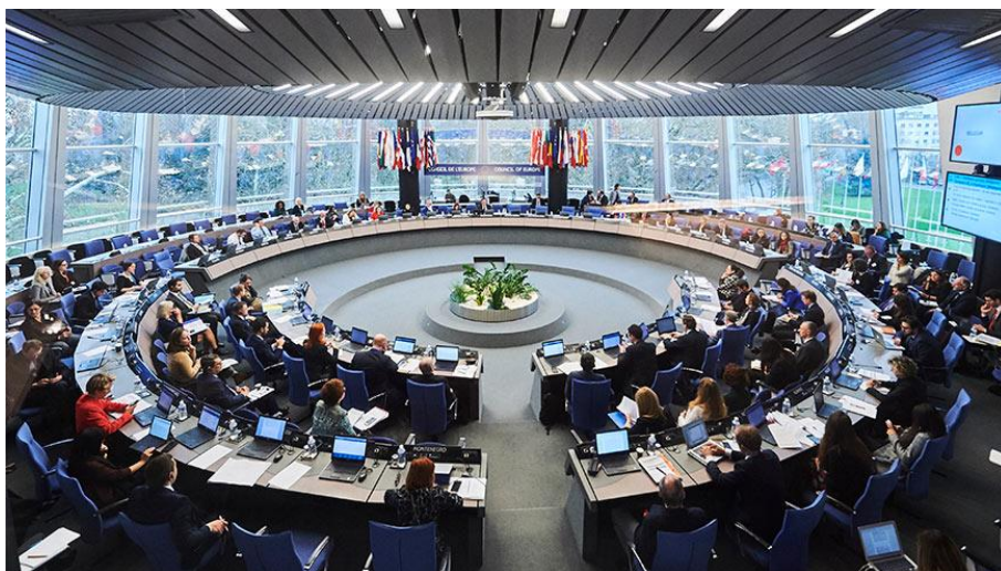
Comité de Ministros en Estrasburgo

Tras la suspensión de Rusia el 25 de febrero, Piotr Tolstoi, jefe de la delegación rusa en la APCE, explicó en su canal de telegram que el Consejo de Europa era imposible sin Rusia.