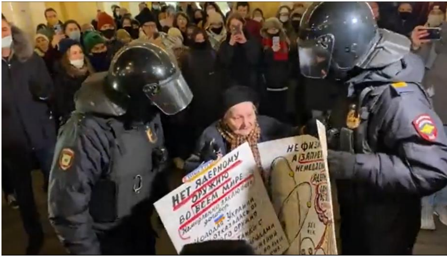
Rusia hoy: detención de un sobreviviente de la Segunda Guerra Mundial por protestar contra la guerra de Putin

Al mismo tiempo, los últimos vestigios de medios de comunicación independientes y de libertad de reunión dentro de Rusia desaparecieron. El New York Times señaló: