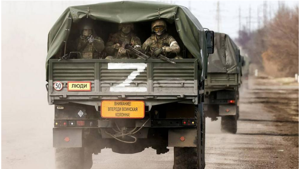
La agresión de Putin