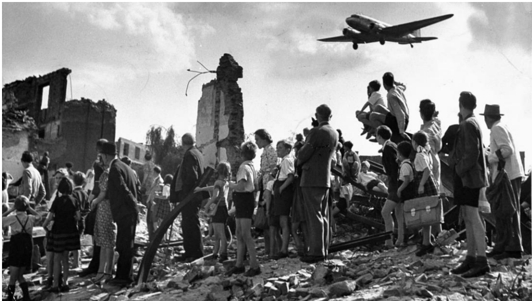
Aviones de transporte de la Fuerza Aérea de EE.UU. durante el puente aéreo de Berlín en 1948

Todo esto se consiguió en 1948, cuando los atormentados berlineses occidentales fueron abastecidos por más de 170.000 vuelos de pilotos aliados. El puente aéreo de Berlín fue una poderosa respuesta política que cambió la política de Europa hasta el día de hoy. Poco después dio lugar a las instituciones del Occidente actual: La OTAN, el Consejo de Europa, los primeros pasos hacia la integración europea. El chantaje de Stalin fracasó.