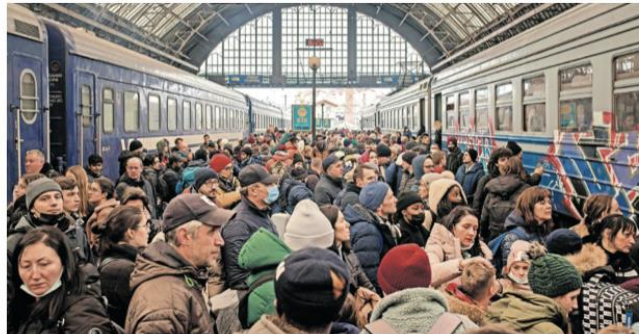
Besonders zu Beginn des Krieges versuchten Tausende, per Zug aus dem Land zu kommen - hier eine Szene aus Lwiv (Lemberg). Gerald Knaus ist dafür, die Menschen per Luftbrücke zu retten.