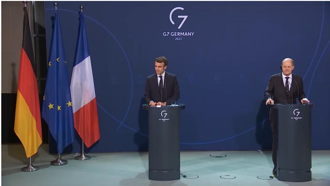
El presidente francés Emmanuel Macron y el canciller alemán Olaf Scholz

Por eso se necesita inmediatamente una pequeña estructura flexible y política, preferiblemente designada para actuar en nombre tanto de la UE como del G7, encabezada mejor por un equipo A de comunicadores capaces y bien conectados -ex jefes de gobierno o altos ministros-. El presidente francés Emmanuel Macron y el canciller alemán Olaf Scholz, que afortunadamente presiden actualmente la UE y el G7 respectivamente, podrían nombrar a este equipo ahora. Se busca: una mezcla entre Lucius Clay, el general estadounidense del puente aéreo de Berlín, y Ernst Reuter, el carismático alcalde de Berlín Occidental de la época, ambos protagonistas de la primera gran prueba política y humanitaria de la última Guerra Fría.