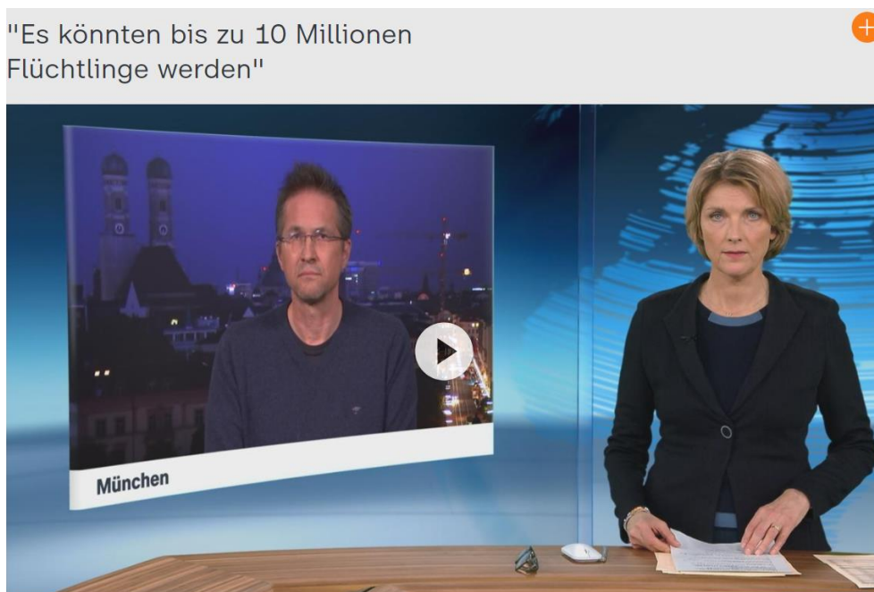
Entrevista en la TV alemana el 5 de marzo