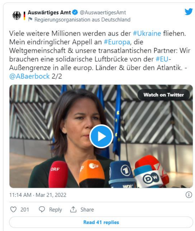
La ministra alemana de Relaciones Exteriores, Annalena Baerbock, solicitando a los socios de la UE y el G7 para establecer un puente aéreo para los refugiados ucranianos

Por eso se necesita inmediatamente una pequeña estructura flexible y política, preferiblemente designada para actuar en nombre tanto de la UE como del G7, encabezada mejor por un equipo A de comunicadores capaces y bien conectados -ex jefes de gobierno o altos ministros-. El presidente francés Emmanuel Macron y el canciller alemán Olaf Scholz, que afortunadamente presiden actualmente la UE y el G7 respectivamente, podrían nombrar a este equipo ahora. Se busca: una mezcla entre Lucius Clay, el general estadounidense del puente aéreo de Berlín, y Ernst Reuter, el carismático alcalde de Berlín Occidental de la época, ambos protagonistas de la primera gran prueba política y humanitaria de la última Guerra Fría.