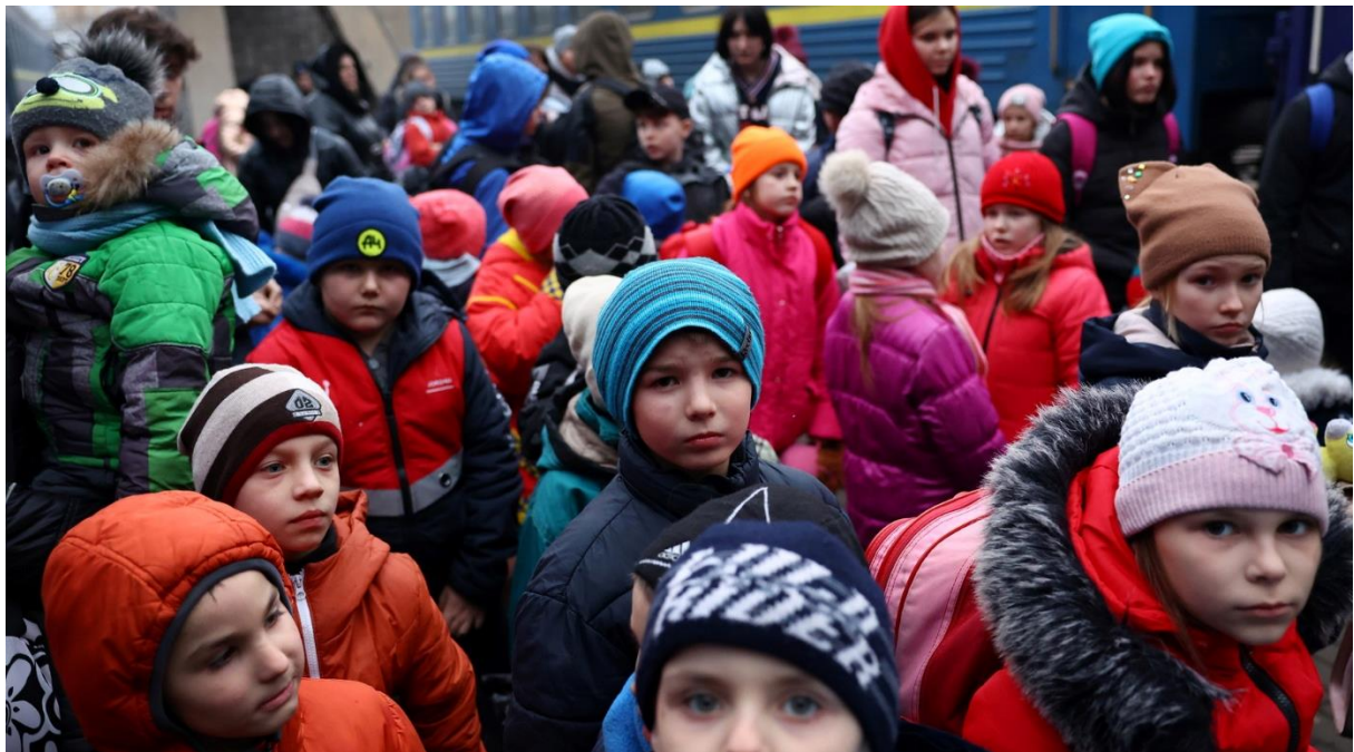
Ucranianos desplazados en Lviv