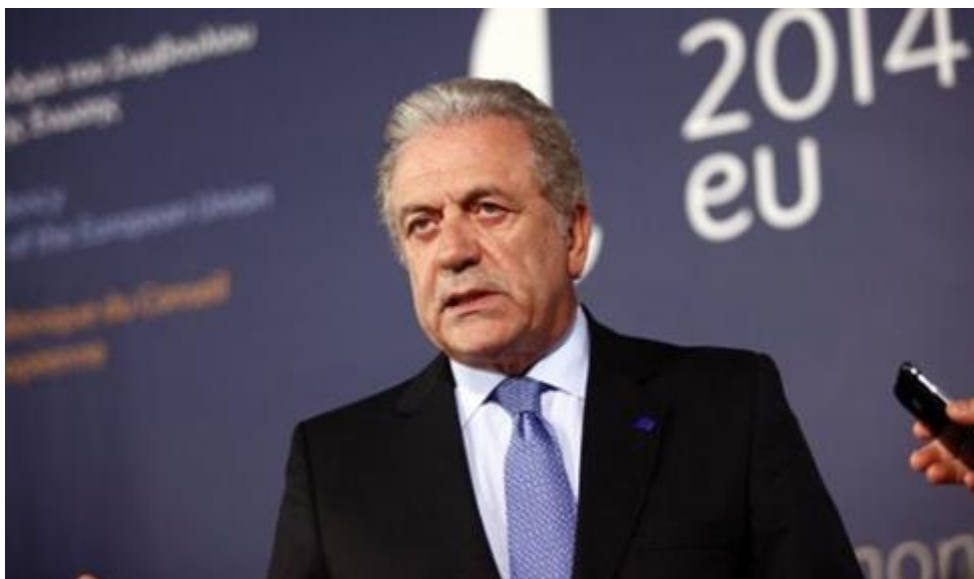
Përballja me krizën: Dimitris Avramopoulos, komisioner për çështje të brendshme, viziton Kosovën këtë javë

Javëve të fundit, analistët e ESI-t kanë diskutuar të ardhmën e liberalizimit të vizave me zyrtarë të lartë të BE-së, ministra dhe ekspertë nga Evropa Juglindore; ne gjithashtu prezantuar propozimet tona në Ankara dhe Stamboll , Sarajevë, Prishtinë , Berlin dhe Bruksel.