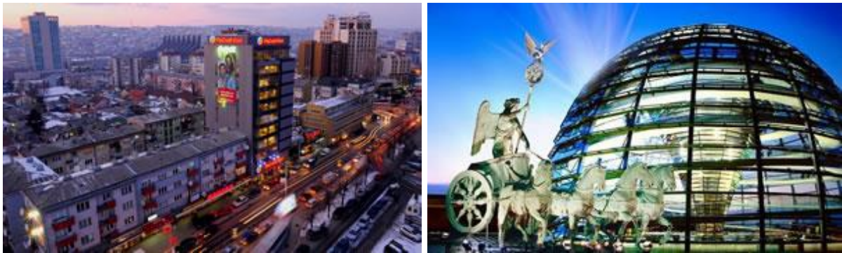
Prishtina (Kosovë) – Berlin (Gjermani)