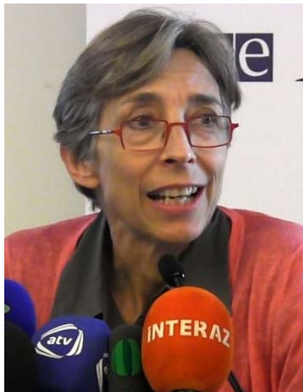
Тана де Зулуэта (Италия) Глава делегации БДИПЧ ОБСЕ