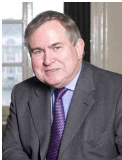
Роберт Уолтер (Великобритания) Глава делегации ПАСЕ Консерватор