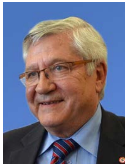
Мишель Вуазен (Франция) Специальный координатор краткосрочных наблюдателей ОБСЕ