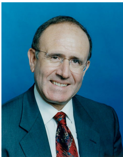
Пино Арлакки (Италия) Глава делегации Европейского Парламента Социал-демократ