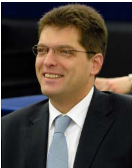
Янез Ленарчич (Словения) Директор БДИПЧ