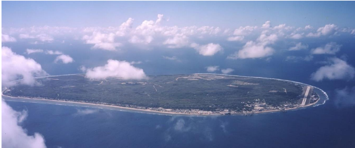
Nauru: Die Zukunft des globalen Flüchtlingssystems?