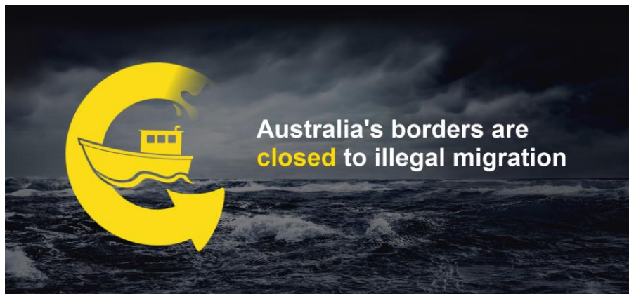
Australiens Website zur „Operation Sovereign Borders“

„Die Botschaft ist einfach: Wenn Sie illegal mit dem Boot nach Australien kommen, werden Sie niemals die Möglichkeit haben, australischer Staatsbürger zu werden. Die Regeln gelten für alle: Familien, Kinder – es gibt keine Ausnahmen.“