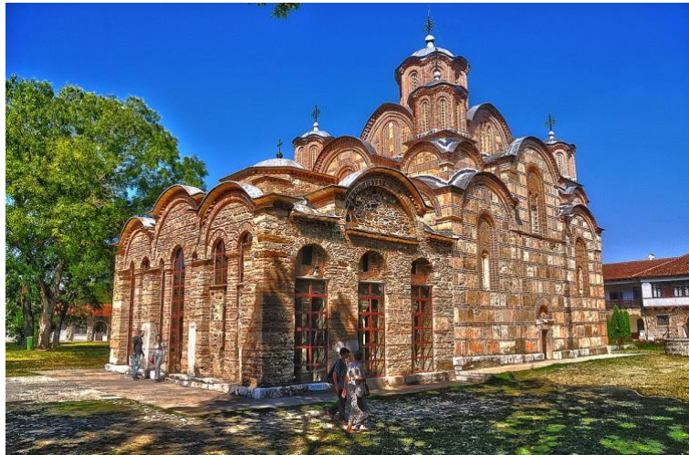
Manastir Gračanica na Kosovu

“Sada ćete prvi put čuti tačne brojeve koje je Republika Srbija, naravno, uvijek znala, ali iz različitih razloga nije željela iznositi u javnost.” Predsjednik Vučić, 2. februar 2024 , o broju Srba na Kosovu